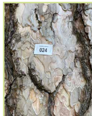
/ Censimento arboreo. Etichetta di riconoscimento e identificazione /