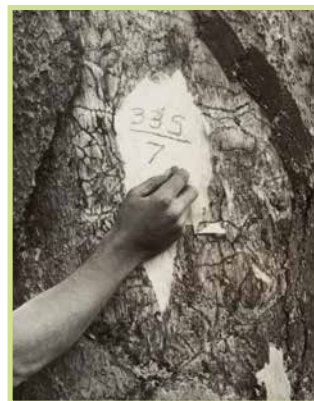
/ Contrassegnatura delle piante – Foto d'epoca /

Il verde è riconosciuto come elemento fondamentale per migliorare la qualità urbana e supportare le reti ecologiche.