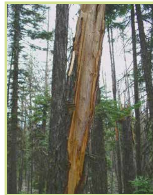
/ Piante danneggiate da abbattere /

Se gli alberi presentano un rischio potenziale (ad esempio per condizioni