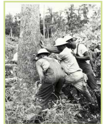
/ Caduta guidata – Foto d'epoca /