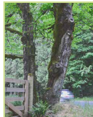
/ Piante vetuste da monitorare /