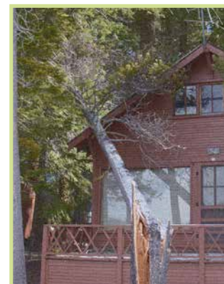
/ Piante schiantate da rimuovere /