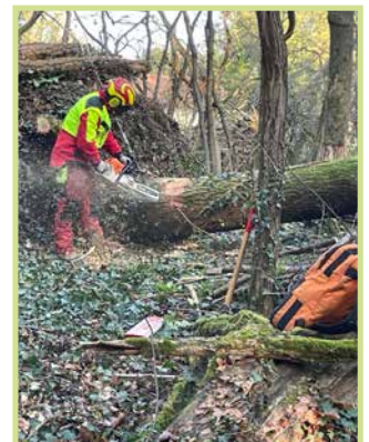
/ Abbattimento con moderne attrezzature e adeguati sistemi di protezione /