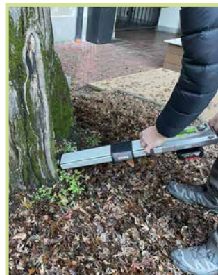
/ Controllo strumentale su esemplare arboreo /