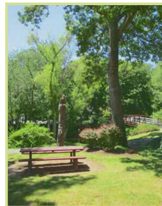
/ Verde pubblico /

Stabilisce criteri per la progettazione sostenibile, come l'uso di vegetazione autoctona o locale, l'adozione di tecniche per mitigare l'effetto isola di calore, e la raccolta e gestione delle acque piovane per irrigazione.