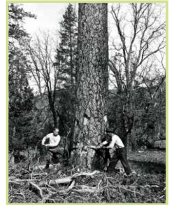
/ Abbattimento manuale in immagine di repertorio /

Queste procedure garantiscono la tutela del patrimonio naturale del Parco e il rispetto delle normative, in particolare quelle legate alla sicurezza e alla gestione sostenibile delle risorse forestali.